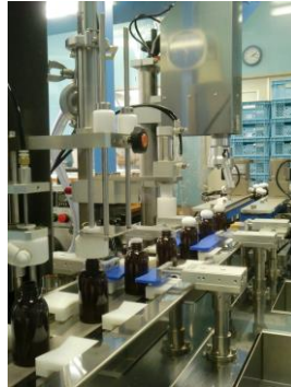
<工場内：自動充填巻締機>