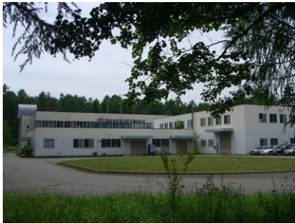
<ハヶ岳近くの蓼科工場>