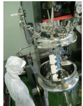
<工場内：真空乳化装置>